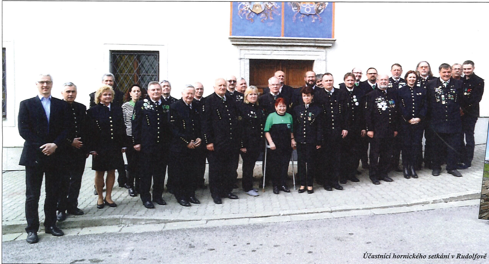
Účastníci hornického setkání v Rudolfově