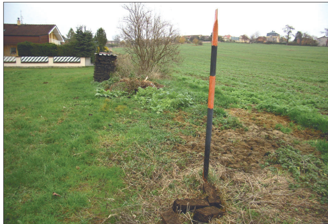
Snímek trasírky umístěné u Domova s pečovatelskou službou, kde probíhá VTP v souběhu se zatrubněnou vodotečí a dále kolem zástavby