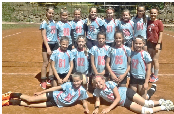
Hráčky okresního přeboru v areálu SK Hlincovka