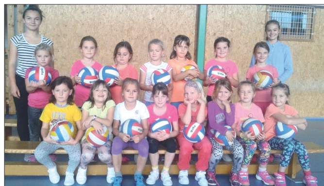
K fotu: Možná budoucí hráčky volejbalu trénující úterky od 14 hodin